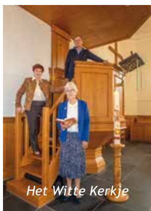
Het Witte Kerkje